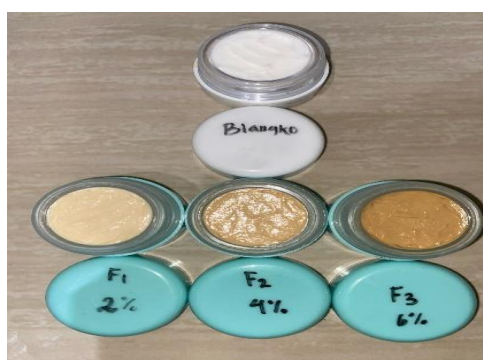
Gambar 1. Hasil Pembuatan Sediaan Foudation

Pengujian aktivitas tabir surya dilakukan dengan menentukan nilai SPF secara in vitro menggunakan UV-Vis Spectrophotometer pada rentang panjang gelombang 290–320 nm. Metode ini banyak digunakan dalam penelitian kosmetik karena mampu memberikan gambaran kemampuan suatu bahan dalam menyerap radiasi ultraviolet. Grafik hubungan antara konsentrasi ekstrak biji nangka dengan nilai SPF dapat dilihat pada Gambar 2.