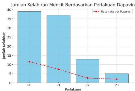
Gambar 1. Grafik Jumlah Kelahiran Mencit Berdasarkan Perlakuan Dapavin

Penurunan yang lebih signifikan terlihat pada kelompok P2, di mana rata-rata kelahiran hanya mencapai 2,60 ekor per populasi dengan total 13 kelahiran. Persentase keberhasilan pada kelompok ini tercatat sebesar 60%, yang merepresentasikan hanya 3 induk yang berhasil melahirkan dari total 5 populasi, sehingga mengindikasikan adanya efek penghambatan reproduksi akibat paparan Dapavin. Efek supresi ini semakin nyata pada kelompok P3, di mana rata-rata kelahiran hanya sebesar 1,00 ekor per populasi dengan total 5 kelahiran. Rendahnya persentase keberhasilan yang hanya mencapai 40% (2 induk produktif dari 5 populasi) membuktikan bahwa dosis pada P3 menyebabkan sebagian besar populasi gagal melahirkan. Data hasil grafik dapat dilihat di bawah ini.